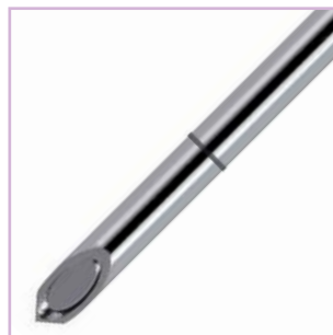
Nadel mit “Flöten-Spitze” Whistle point needle