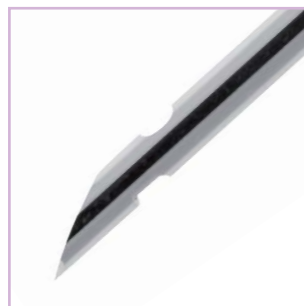
Nadel mit 2 Löchern 2 holes cannula