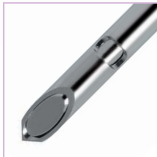
Nadel mit "Flöten-Spitze" Whistle tip needle