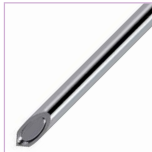
Nadel mit "Flöten-Spitze" Whistle tip needle