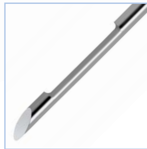
Ultraschall-Marker I Echogenic marker I