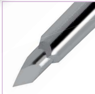
Trokar-Spitze Trocar tip