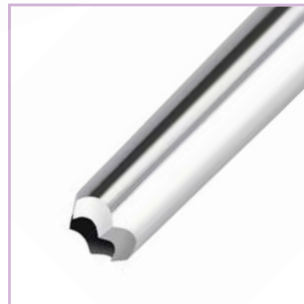
Kanüle mit "Kronenschliff" Crown tip cannula